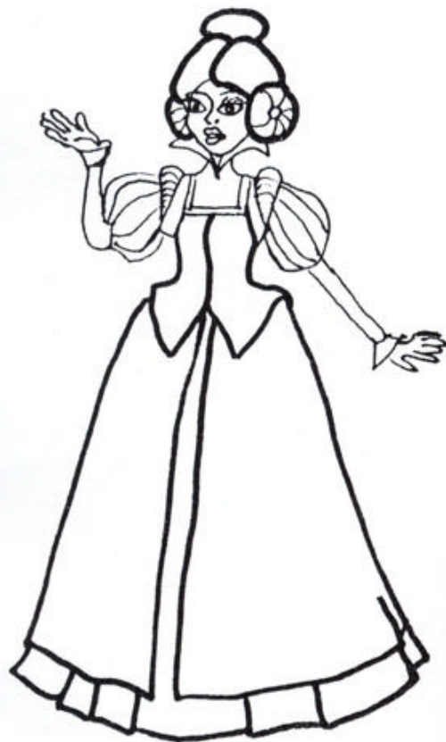
Dulcinea del Toboso

¡Oh, cómo se holgó nuestro buen caballero cuando hubo hecho este discurso, y más cuando halló a quien dar nombre de su dama! Y fue, a lo que se cree, que en un lugar cerca del suyo había una moza labradora de muy buen parecer, de quien él un tiempo anduvo enamorado, aunque, según se entiende, ella jamás lo supo, ni le dio cata dello. Llamábase Aldonza Lorenzo , y a ésta le pareció ser bien darle título de señora de sus pensamientos; y, buscándole nombre que no desdijese mucho del suyo, y que tirase y se encaminase al de princesa y gran señora, vino a llamarla Dulcinea del Toboso , porque era natural del Toboso; nombre, a su parecer, músico y peregrino y significativo, como todos los demás que a él y a sus cosas había puesto.